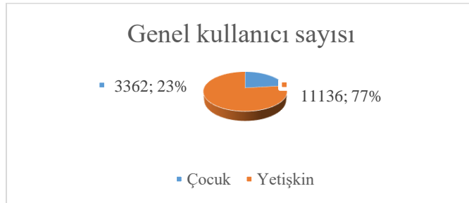
Genel kullanıcı sayısı ve dağılımları (2023 yılı)