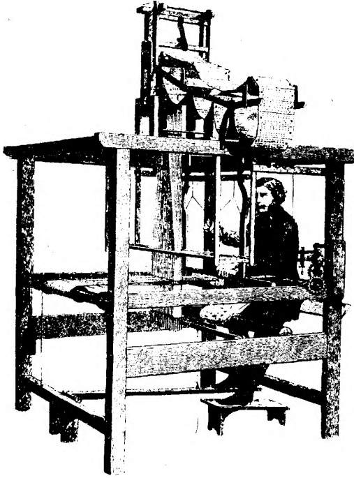
Joseph Marie Jacquard'ın delikli kartlarla kontrol edilebilen dokuma tezgâhı

7 — Çıktı (output) ünitesi : Bilgisayardan elde edilen neticeleri okunabilir bir şekilde, günlük lisanda yazıp veren ünite.