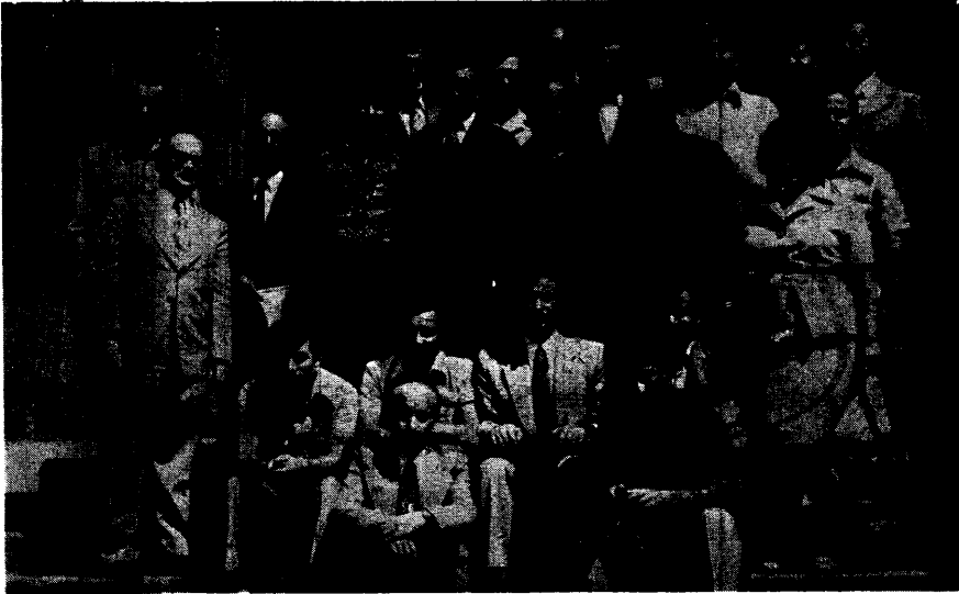
Cilt atölyesi bulunan kütüphanelerin müdürlerinin katıldığı kurs