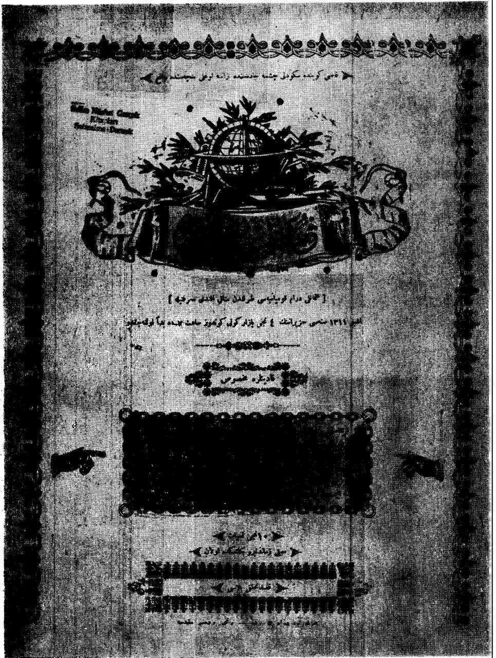
Sergilenen belgelerden : Kadıköyün'de Söğütluçeşme Osmanlı Tiyatrosu'nun kadınlar için temsil ilanı