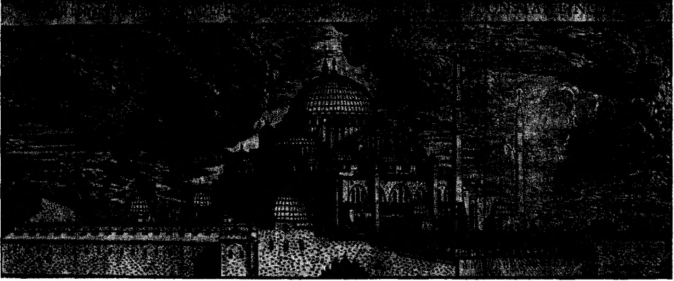
Thesaurus Exoticorum... adlı 1688 basımı kitaptan Süleymaniye Camii

Der Eintritt der Türkei in die Europäische Politik des achtzehnten Jahrhunderts von Hermann Abeken. Mit einem Vorworte von K. Stüve. Mit Aktenstücken. Berlin 1856 Verlag von Wilhelm Hertz. (Bessersche Buchhandlung).