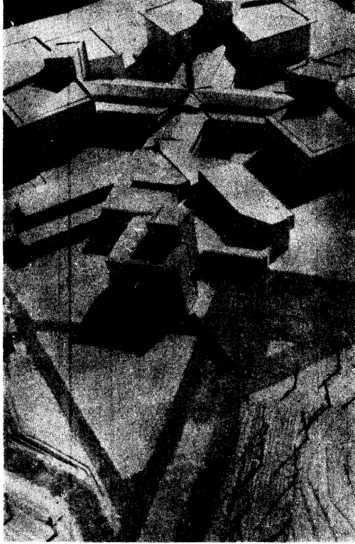
DEVLET ARŞİV SİTESİ — MAKET GÖRÜNÜMÜ

Arşiv hizmetlerinden beklenen verim, büyük ölçüde, ilmi anlamdaki arşivciliğin gerektirdiği teknolojinin bütün imkânları ile donatılmış modern arşiv binalarının tesisi ile mümkündür. Bugün bütün dünya ülkeleri devlet arşivlerini, bu mânâda inşa ettikleri yeni arşiv binalarına nakletmektedirler. Dünyanın en zengin arşivlerinden birine sahip olan ve arşiv hizmetlerini son derece sağlıklı bir şekilde yürüten İngilizler, millî arşivlerini (National Archives - Public Record Office —) Londra'nın dışında Kew Gardens'deki yeni arşiv binalarına taşımaktadırlar. 7 - 23 Mayıs 1977 tarihleri arasında Londra'da Public Record Office'de meslekî konularda yaptığımız araştırmalar sırasında, bu binayı da gezmek ve ilgililerden gerekli bilgiyi alma imkânını elde etmiştik. Bu son derece modern arşiv binasını bir başka yazımızda çeşitli yönleri ile müstakilen tanıtmak istiyoruz.