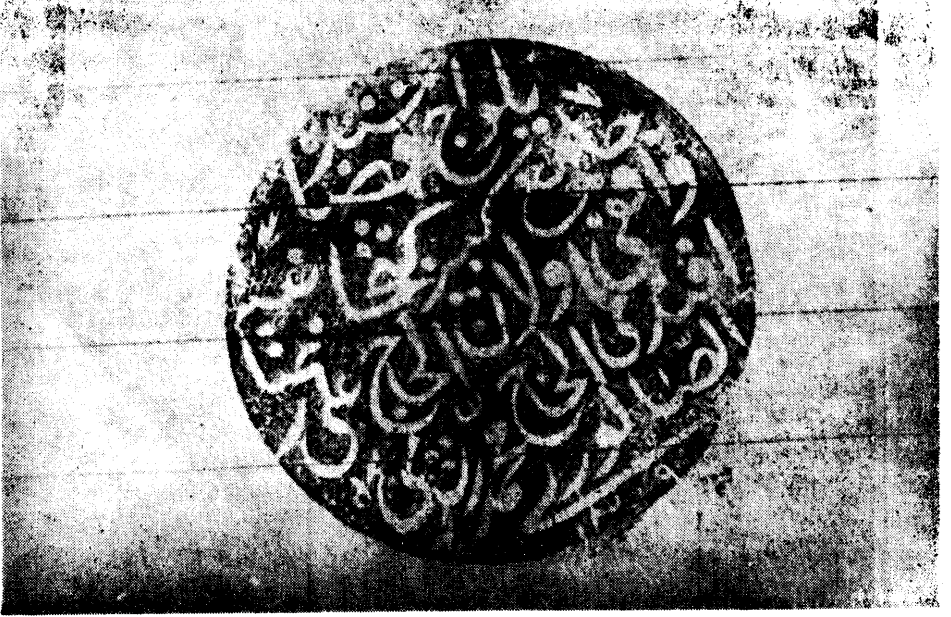
3. Resim — Mühür (1/b)