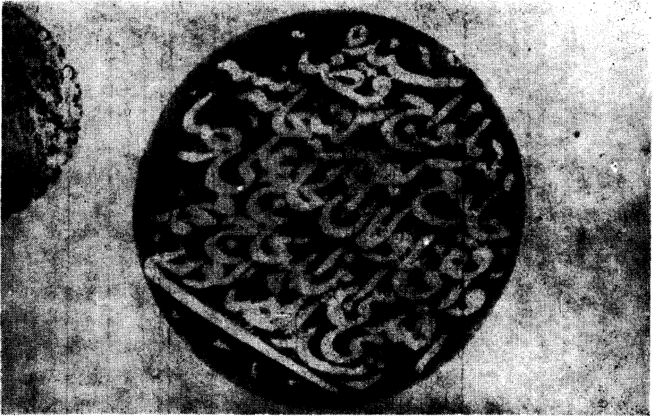
2. Resim. — Mühür (1/a)

Kütüphanenin ilk kurulduğu yer; bundan 45 - 50 sene öncesine kadar ayakta bulunan caminin bitişiğindeki «Muvakkit-hane» imiş; sonradan yol genişletilirken yıkılmıştır.