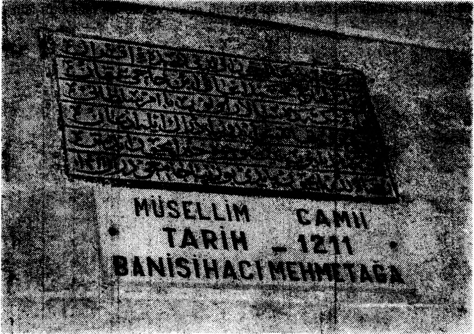
Müsellim Camii Kitabesi